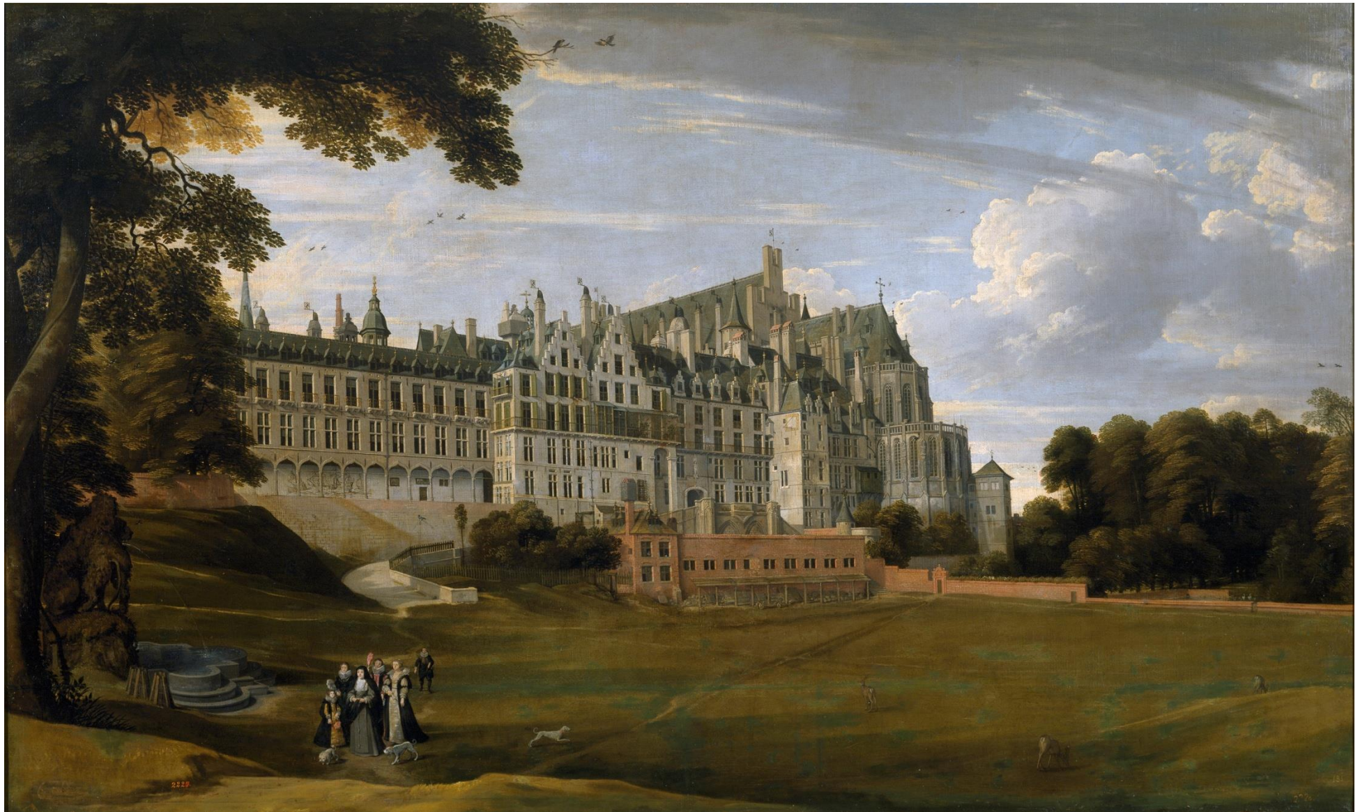
Anonyme, L'Infante Isabelle en costume de Clarisse dans le parc du palais, huile sur toile, 17 e siècle, Musée du Prado, Madrid.