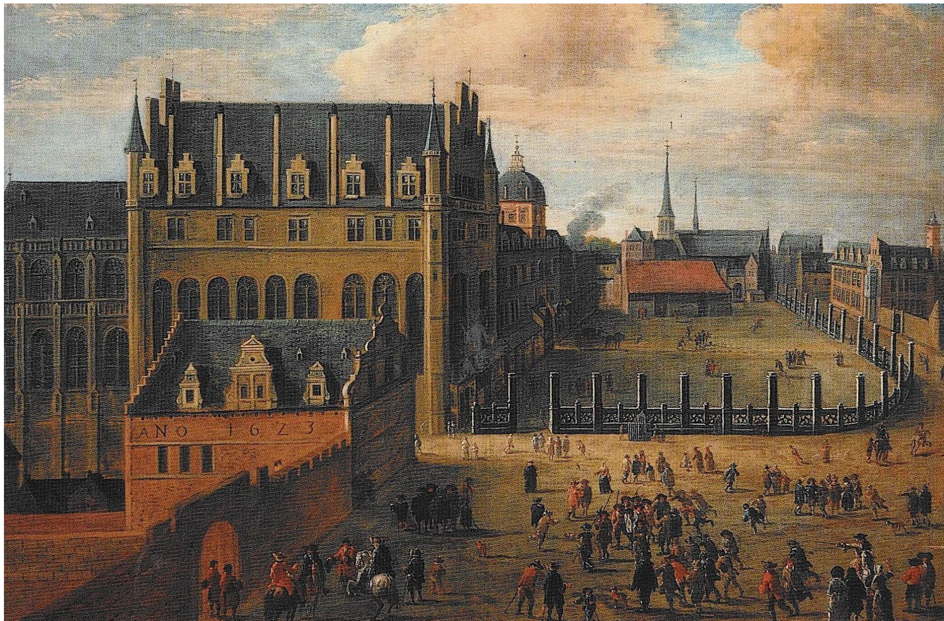
Anonyme (monogramme G.V.A.), Vue du palais et des Bailles, huile sur toile, 17 e siècle, Maison du Roi, Bruxelles.