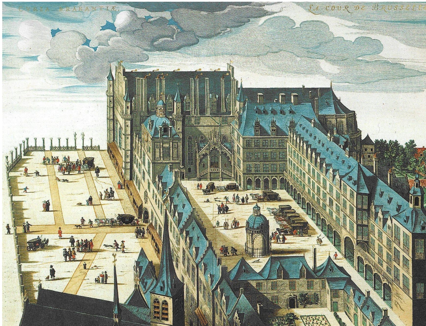
J. Van de Velde, Curia Brabantiae in celebri et populosa urbe Bruxellis , burin, 1649, Österreichische Nationalbibliothek, Vienne.