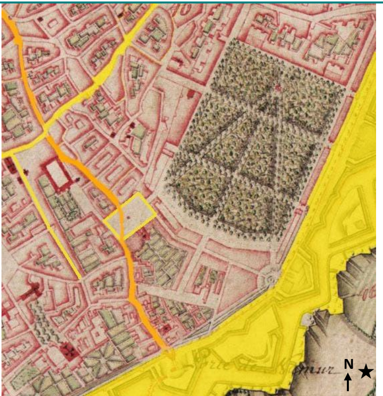
J.J.F. de Ferraris, Carte de cabinet des Pays-Bas autrichiens (détail), 1777.

La première enceinte n'est plus visible, la seconde enceinte a été renforcée par des bastions triangulaires.