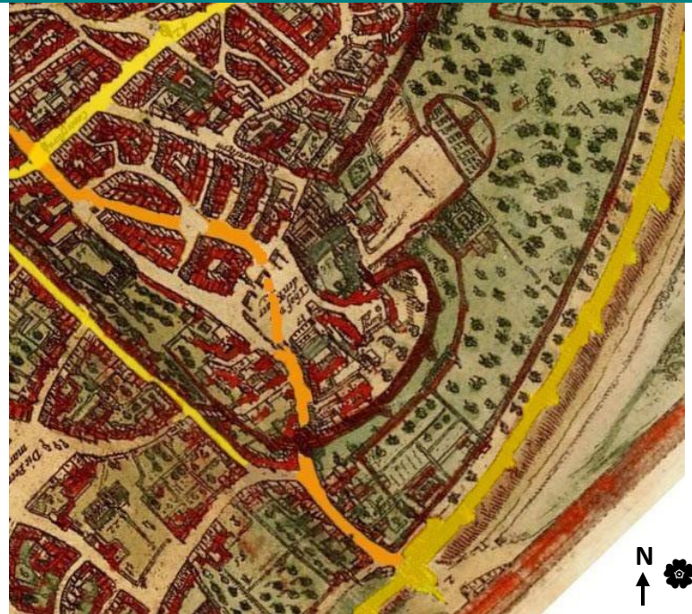
G. Braun et Fr. Hogenberg, Plan de Bruxelles (détail), 1572

→ La place Royale n'apparaît pas puisqu'elle n'existe pas encore.