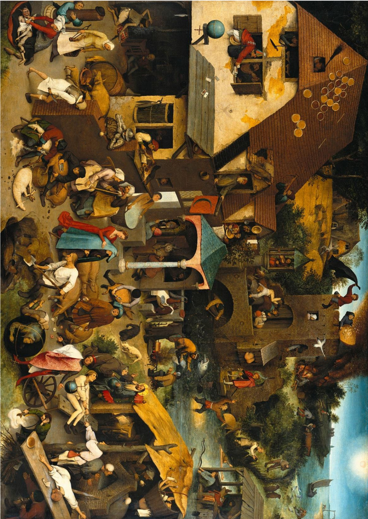
Les proverbes flamands - 1559 (117 x 163 cm, Berlin, Staatliche Museum)