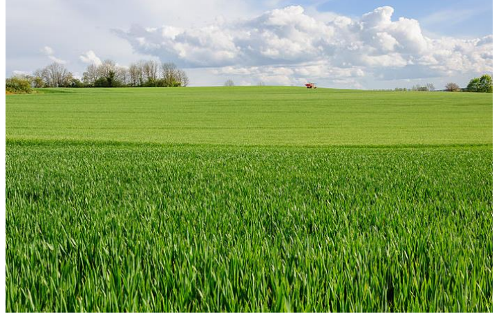
champs de blé