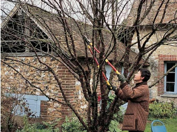
Taille des arbres