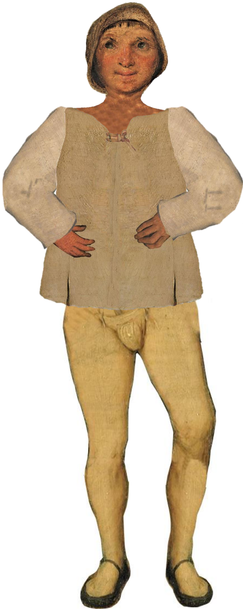
Bruegel - Habille un paysan ! - [2]