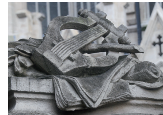
Tombe de la pianiste Marie Pleyel, Laeken