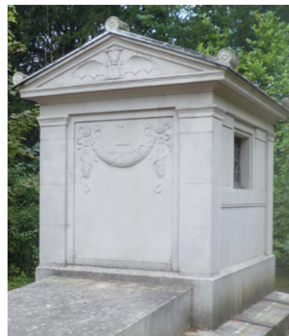
Chapelle néogothique et temple à l'antique, cimetière du Dieweg,