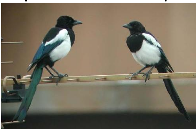
Les pies se mettent en couple