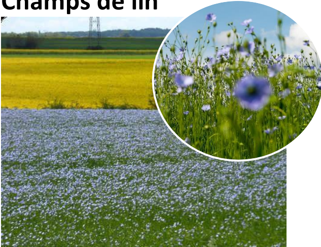
Champs de lin