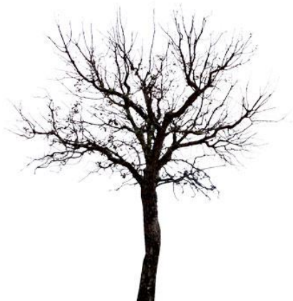
Arbres sans feuilles