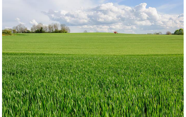
champs de blé