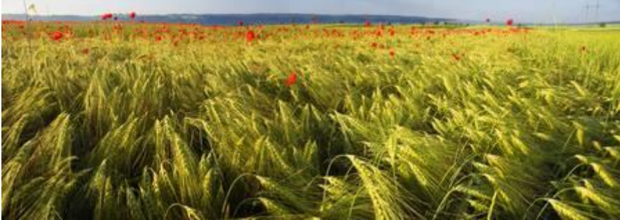
Coquelicots dans les champs